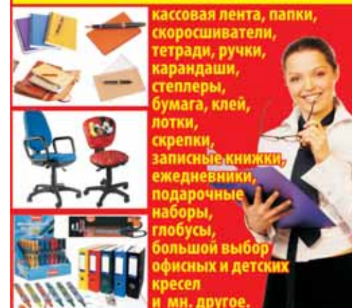
График работы: Пн.-пт. - 10:00-20:00, Суб.-Вскр.- 10:00-18:00 Ждем вас! 8-903-002-84-47