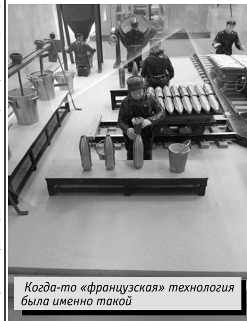
Когда-то «французская» технология была именно такой

Ускорить процесс, сделать его более технологичным помогла, в том числе и... – чем бы заменить навеянное лисами и зайцами слово «косолапость»? – неосторожность, неловкость, конфузия. Нет, сначала наши люди – которые и с головой, и с руками – придумали делать из взрывчатого вещества своего рода «столбики», которыми и наполня-