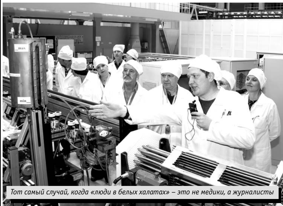
Тот самый случай, когда «люди в белых халатах» – это не медики, а журналисты

Бывать на различных производствах люблю с детства, с «профорientационных» экскурсий. Как любил и люблю прихватывать что-то на память. Машиностроительный завод, выпуска-