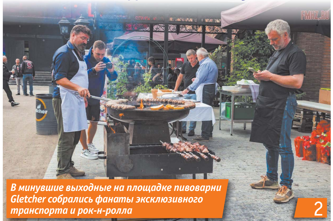
В минувшие выходные на площадке пивоварни Gletcher собрались фанаты эксклюзивного транспорта и рок-н-ролла

г. Клин, Бородинский пр-д, д. 1 (у кольца на пересечении с ул. Гагарина)