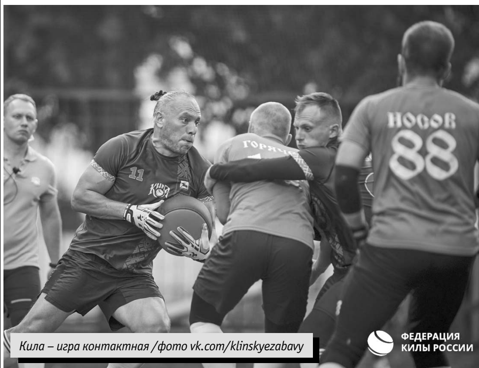
Кила – игра контактная

Несмотря на ощутимую разницу в мастерстве, удовольствие от игры получили и те, и другие. Впереди у клинской «Ватаги 1317» главное соревнование сезона. В конце сентября в Москве пройдет титульный всероссийский турнир «Богатырская сеча».