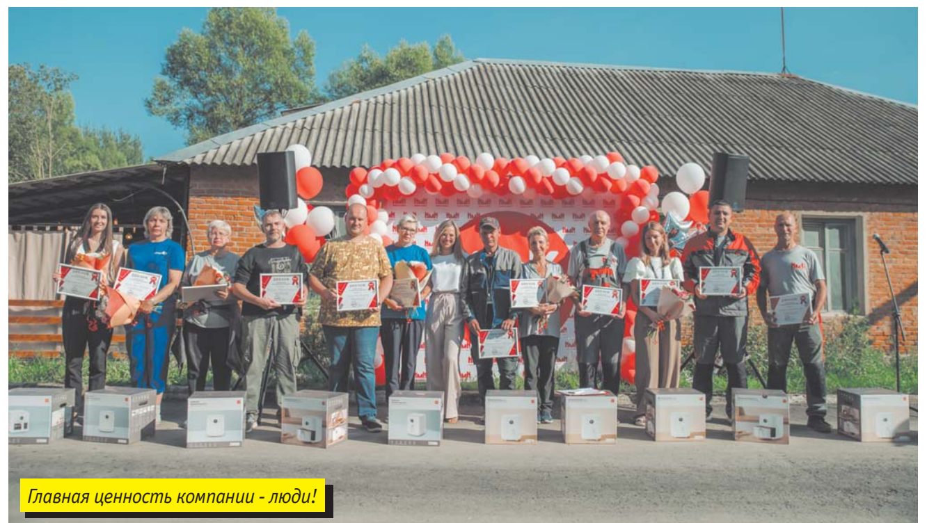
Главная ценность компании - люди!

– Наш главный актив — это люди! У нас сплоченный коллектив и лояльное руководство. Мы стараемся предоставить максимально комфортные условия труда и отдыха для наших сотрудников!