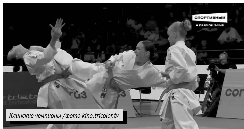
Клинские чемпионы

Ката – это последовательность движений, моделирующая ведение боя с воображаемым противником или группой противников.