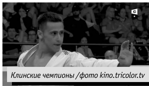
Клинские чемпионы

С 23 по 25 августа в Международном центре самбо и бокса в Москве проходил чемпионат России по каратэ среди мужчин и женщин. В соревнованиях приняли участие более 400 спортсменов из 51 региона страны. Спортсмены филиала «Лидер-Каратэ» СШОР «Клин Спортивный» завоевали 3 золотые, 3 серебряные и 5 бронзовых медалей.